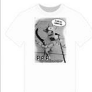
CAMISA GATO CANTOR R$ 30,00

“Que os nossos esforços desafiem as impossibilidades. Lembrai-vos de que as grandes proezas da história foram conquistas daquilo que parecia impossível.”