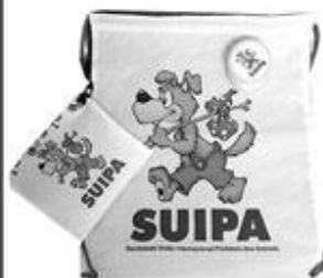
SACOMOCILA R$ 22,00