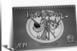
CALENÁRIO 2019 R$ 20,00