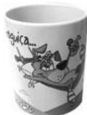
CANECA PAZ R$ 25,00