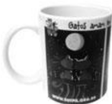
CANECA GATO R$ 25,00