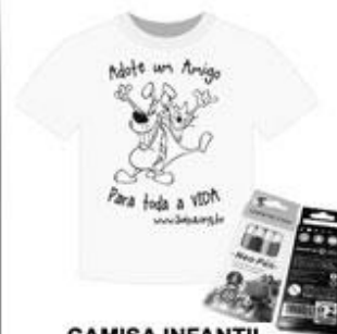
CAMISA INFANTIL R$ 28,00