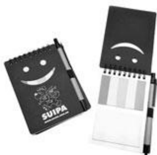
CADERNETA 2019 R$ 20,00